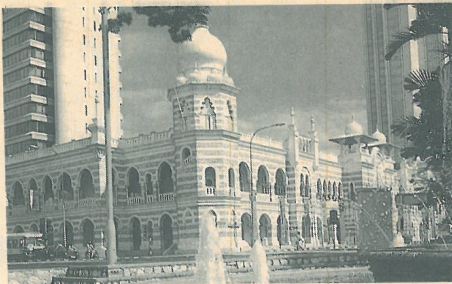
阿都·薩馬德 蘇丹大廈 現為 最高法院 所在地

馬來西亞是一個多元種族的國家，因此宗教很多，而宗教可以看出各民族的文化背景，曾經有一位畫家說過：如果要把馬來西亞繪在畫上，他必須先畫上一個清真寺，一群身穿花布沙龍的馬來婦女在伏身默禱；他又必須再畫上一個中國寺廟，香煙裊繞中穿黑布唐衫的中國老婦人在上香唸經；然後再畫一個印度教寺院，頭纏白布，臉蓄鬍鬚的印度人正在靜坐冥思。當然，還得在山巔海涸添上幾個赤裸上身，矮小粗壯的土著民族。如此四個畫面，出現在同一張畫布上，似乎顯得很怪異；但是它們合在一起，便正是馬來西亞了。