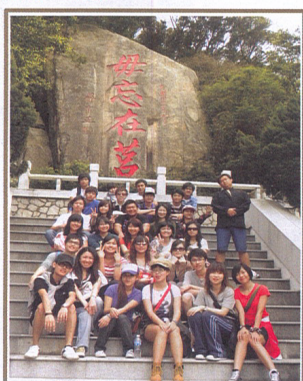
「毋忘在莒」由蔣公親題，意取戰國齊將田單以莒和即墨兩城為藉，用火牛陣大敗燕軍，收復七十餘座失城的奮鬥過程。

太武山是金門第一高山，別稱「仙山」。負責帶隊的導遊更笑稱太武山有25300公分，試圖讓我們在單位換算間產生混淆。在太武山下一路步行而上，到處可見斑駁蒼勁的花崗岩石。路途中更有大石「毋忘在莒」，紅紅顯眼的四字顯示出當時戰地抗戰軍民的精神標竿。