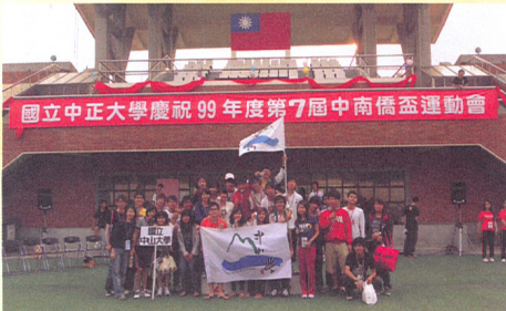
國立中正大學慶祝 99 年度第 7 屆中南僑盃運動會