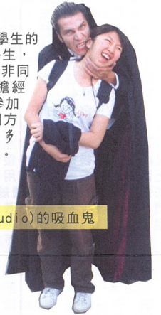
洛杉磯環球影城 (Universal Studio) 的吸血鬼

答：我很推薦學弟妹們參加這個方案，可利用我們大學生的身分享有赴美打工旅遊這個優待。雖然我們都是留學生，離開家鄉來台灣讀書，不過天外有天，如果你想有個非同尋常又具有挑戰性的暑假，取得家長同意並可以負擔經濟上的問題，學弟妹們可以計畫參加這個方案。我建議有意參加這個方案的學弟妹：要多問，多打聽，多準備，免得事後產生很多困難。學弟妹們，加油！