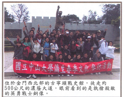
位於金門西北部的古寧頭戰史館，徒走約500公尺的濃蔭大道，眼前看到的是執槍殺敵的英勇戰士銅像。

古寧頭戰史館是紀念古寧頭戰役的光榮勝利。民國38年10月24日晚，共產黨與國民黨在古寧頭一帶浴血激戰，經歷56小時，史稱「古寧頭戰役」。這是國軍退守台灣，以弱抵強的轉捩點，奠定台海對峙的局勢。戰史館前牆壁左右各有兩幅浮雕畫作，記述古寧頭的浴血戰事。另一馳名中外的建築則是莒光樓。莒光樓是仿古代麒麟閣的三層樓建築，用以表彰當時的英勇事蹟。