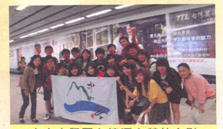
中山大學團在捷運左營站合影

午餐後，大伙兒前往參觀高雄世運主場館（現為國家體育場）。那宏偉的體育館，可讓人聯想到比賽時啦啦隊高漲的情緒，觀眾沸騰的歡呼聲和選手精彩的表現。經過導覽員的介紹後，大家了解體育館設有令人嘆為觀止的設備：4萬席座位，屋頂上的太陽光電發電系統以及多功能的草地等。