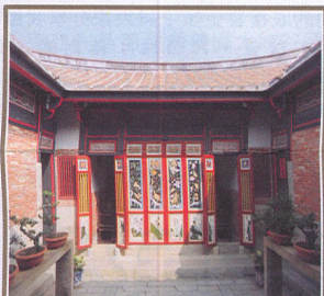
《古厝》/草籽 斷牆殘瓦已全非，家族興衰表徵微。 歷盡滄桑空寂矣，寒風瑟瑟把厝圍。

往外探勘，一座座的閩南式建築在眼眶中跳躍。踏進金門聚落，仿佛就像我們電視連續劇所熟悉的場景。今次造訪的是山後民俗文化村，為金門晚清時期的僑村，計十八棟傳統大厝。聚落結構分為上社及下社。