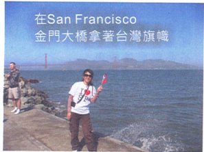
在San Francisco 金門大橋拿著台灣旗幟

答：由於這是赴美旅遊最便宜的管道，我就利用大學生的身份，不想錯過這個機會，帶著冒險的精神赴美找尋經驗，並實踐從小學習的英語。