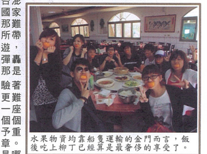
水果物資均靠船隻運輸的金門而言，飯後吃上柳丁已經算是最奢侈的享受了。

歷史的足跡在蕩漾，金門從台澎安全的第一道防線蛻變為如今的國家公園，供觀光之餘更是讓人細嚼那難以磨滅的抗戰回憶，警惕著戰爭所帶來的血債故事。3天2夜的金門春遊，細想踏在腳下的石墩路是曾經砲彈轟炸的地方；經過數個古厝聚落，那是聚集了漂洋移民的內心歸屬；體驗者行走坑道，呼吸著薄弱的氧氣，更難想像全民皆兵抗戰的艱難情景；一座座風獅爺的背後，支撐著的是個個聚落居民的精神寄托與祈願。賦予重任的歷史館，訴盡曾經的血淚篇章。回溯歷史的當兒，令你想起的又是哪一章呢？