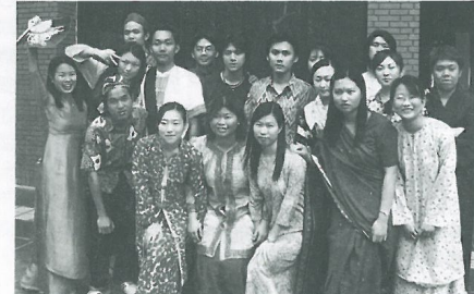
異國服裝秀熱鬧登場

事實上，總召的角色只是在於策劃和安排活動，活動辦理的成功與否，還是在於整個團隊的熱心參與，否則召