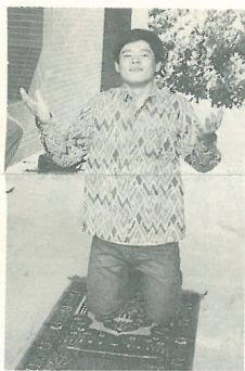
僑生示範僑居地文化，拉攏告、敬拜。

在美食街裡，每天都有不同餐點供應。響頭炮的是韓國「泡菜拌飯」，酸辣的泡菜加上爽口的海帶豆乾肉絲作伴菜，口感真是一絕！再來就是港澳地區的「什錦沙拉通心粉」和「火腿蛋公仔麵」，前者為聚會點心，後者則為香港特色早餐之一。而馬來西亞特色美食當然少不了「咖哩雞飯」和「肉骨茶」。歷年來咖哩雞飯都十分暢銷，今年加上肉骨茶，才一推出，不消幾分鐘就已售罄。最後登場的是印尼的「沙爹串燒」及緬甸的「金三角」，嫩嫩的雞肉淋上特製的沙爹醬，金黃鬆脆的外皮包裹著軟的咖哩馬鈴薯，光是形容就已經叫人垂涎三尺了！而當場吃過的同學更是讚不絕口。