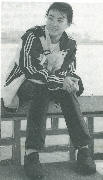
看到麗冰也會有靜若處子的時候，你很難聯想其動若狡兔的英姿吧！

冠軍以及女雙亞軍，首次參賽便一鳴驚人。她亦相當慶幸能獲得如此傲人的成績，也感激朋友、同學們的支持與鼓勵。