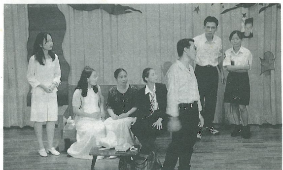
<生命線傳奇>之傳奇事件

偉源、永泰兩位學長表演相聲。其幽默的對話，以及逗趣的表情，台下觀眾幾乎是笑聲不斷，兩位學長果然有大師級的水準。